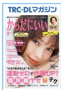
からだに いいこと